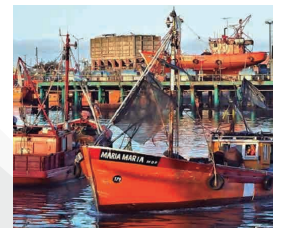
PUERTO DE MDQ