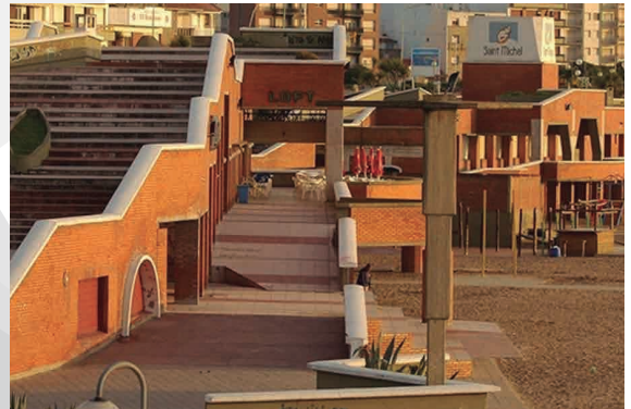
MAR DEL PLATA PLAYA LA PERLA